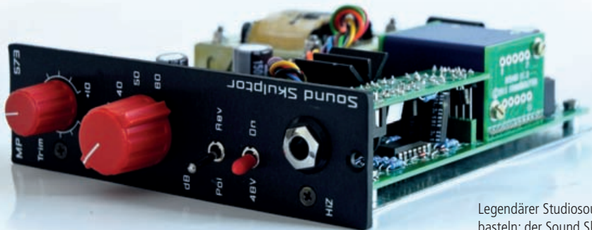
Legendärer Studiosound zum Selberbasteln: der Sound Skulptor MP-573 Preamp-Bausatz

Nach einigen Stunden Arbeit entsteht nach und nach aus dem Sammelsurium der Bauteile eine fertige Mikrofonvorstufe. Eine der größten Fehlerquellen beim Selbstbau von Audioschaltungen liegt in der externen Verkabelung – Sound Skulptor hat konsequent versucht, diese Fehlerquelle zu beseitigen. Die „Lunchbox“ stellt ja schon alle benötigten physikalischen Aus- und Eingänge bereit. Die einzigen Kabel auf der Vorstufenplatine – die Kabel zu und vom Ausgangstransformator – sind bereits mit einem Platinenstecker versehen und müssen nur noch auf das entsprechende Gegenstück gesteckt werden – idiotensicher also.