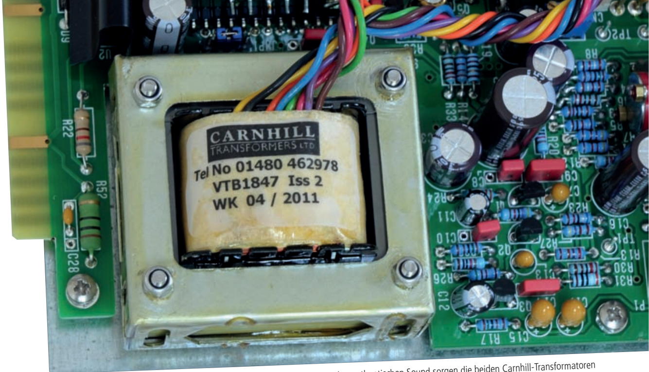
Für den authentischen Sound sorgen die beiden Carnhill-Transformatoren